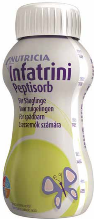
Infatrini pps sondevoeding, waarmee Lieke het ziekenhuis verlaat.

dat je hierin te hoog zit. Lieke had bijvoorbeeld een forse inname van vitamine D met haar voeding en de standaard suppletie. Vaak kan met behulp van een laboratoriumbepaling bekeken worden of het nodig is de inname bij te stellen.